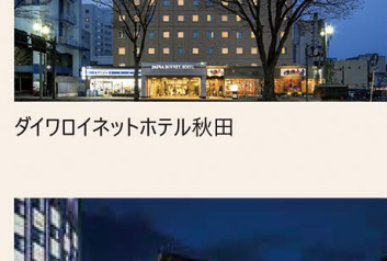
ダイワロイネットホテル秋田

※物件の最寄りにダイワロイネットホテルがない場合は2万円分のギフトカードを進呈いたします。