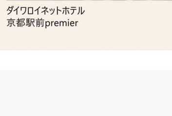
ダイワロイネットホテル 京都駅前premier

※2023年12月9日(土)～2023年12月24日(日)までに対象物件のマンションギャラリー・モデルルームにご来場いただいた方が対象です。 ※対象物件：プレミスト札幌環状通東ステーションサイド、プレミスト旭川ザ・タワー、プレミスト秋田中通ザ・レジデンス、プレミスト郡山StationCross、プレミスト郡山長者、プレミスト藤が丘、プレミスト京都 四条堀川、プレミスト京都五条、プレミスト岡山ザ・レジデンス、プレミスト那覇新都心 ザ・パークフロント、プレミスト首里金城町、プレミスト北谷伊平Sea&Forest、プレミスト浦添港川 ※ご宿泊いただくホテルは当社指定(大和ハウスグループのダイワロイネットホテル)とさせていただきます。 ※ホテルのご指定はお受けいたしかねます。 ※現地マンションギャラリー・モデルルームへご来場いただいた際は、アンケートの回答にご協力をお願いいたします。 ※ご宿泊いただける人数は2名様までとさせていただきます。 ※ホテルのご指定は現地マンションギャラリー・モデルルームご来場の当日に限ります。見学前日のご宿泊はお受けいたしかねますので、ご了承ください。 ※自宅から現地までの往復の交通費と滞在中の交通費はお客様負担となります。 ※大和ハウスグループ関係者は対象外です。詳細は担当営業までお問い合わせください。 《旅行実施会社の社名と旅行業の免許番号》 株式会社伸和エージェンシー ツーリスト事業部 観光庁長官登録 旅行業第1618号(一社)日本旅行業協会 正会員