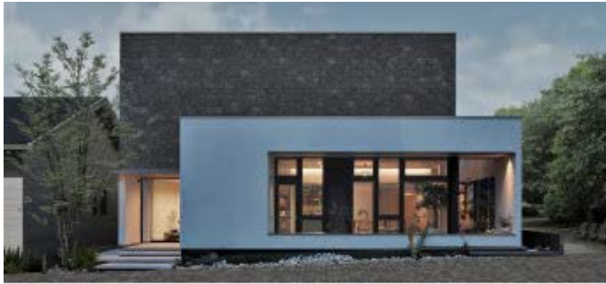
住宅「CENTURY -NEUTRAL MODEL-」

グッドデザイン賞は日本で唯一の総合的なデザイン評価・推奨の仕組みであり、デザインによって暮らしや社会をよりよくしていくための活動を展開しています。ミサワホームは1990年から今年まで、住宅業界で唯一の34年連続受賞を果たしました。住宅商品57点をはじめ、通算受賞点数は172点と、住宅業界では最多の実績です。