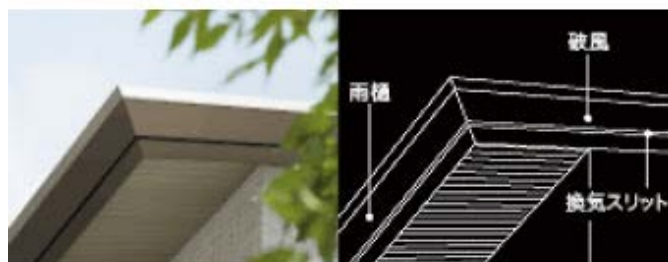
ディテールの美しさまでこだわったアルミ樋 2012年グッドデザイン賞受賞

ミサワホームはこれからもグッドデザインを追求しながら、ご家族のニーズに応えるだけでなく、暮らしの変化を予測した持続可能な住まいづくりを行っていきます。そして、保育や介護などまちづくりの視点で社会課題の解決に寄与する暮らしのデザインに取り組んでいきます。