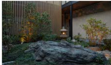
集合住宅「森田屋石亭」