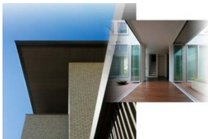
デザイン思想を支える「シンプル・イズ・ベスト」

それは、「シンプル・イズ・ベスト」というデザイン思想のもと、部材の一つひとつまでグッドデザインであることにこだわり、ディテールまで美しさを追求したオリジナル部品を開発し続けてきたからこそその実績です。ミサワホームの住まいには、グッドデザイン賞を受賞した部材が使われています。そこに住むことは、グッドデザインと暮らすことだともいえるでしょう。