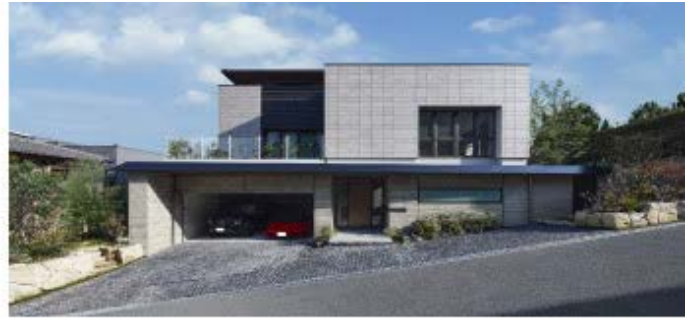
住宅「坂道に建つ家-II」