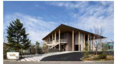
認定こども園 「コピープリスクールつつみの」※2