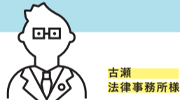
古瀬 法律事務所様

低コストで使いやすいクラウドサービスは、開業時の希望にぴったりでした。日々利用していく中で、クラウドサービスの利便性の高さを実感しています。