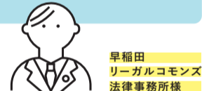
早稲田 リーガルコモンズ 法律事務所様

外部アプリの連携とサポートが充実していた点が、firmeeを選んだ決め手でした。また、リモートワークへの移行を順調に行うことができたのは、firmeeのおかげです。