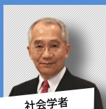
社会学者 橋爪大三郎