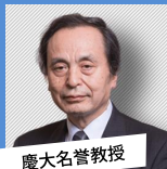
慶大名誉教授 曾根泰教