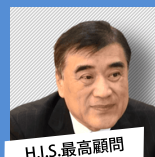
H.I.S.最高顧問 澤田秀雄