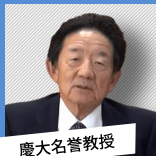
慶大名誉教授 島田晴雄