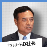
サントリーHD社長 新浪剛史